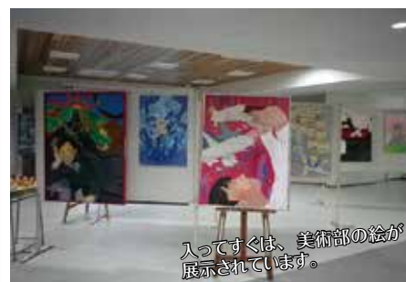
入ってすぐは、美術部の絵が展示されています。