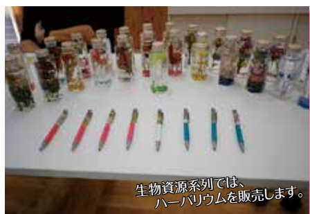
生物資源系列では、ハーバリウムを販売します。