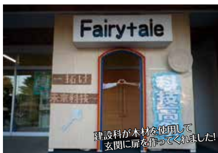
建設科が木材を使用して玄関に扉を作ってくれました!