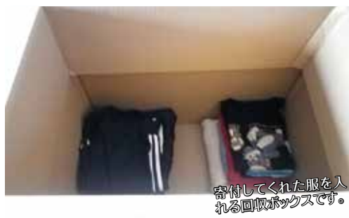
寄付してくれた服を入れる回収ボックスです。