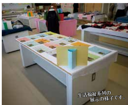
生活福祉系列の展示の様子です。

わたしたち能代科学技術高校では、10月1日、2日に文化祭があります。昨年は、新型コロナウイルスの影響により文化祭は行われたものの一般公開がなく、校内だけの開催でした。今年は、生徒の家族だけ限定の一般公開があります。去年よりも制限が少ないので生徒たちは、テンションをあげて準備をしています!