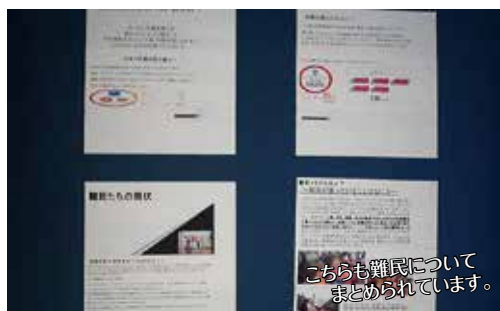
こちらにも難民についてまとめられています。